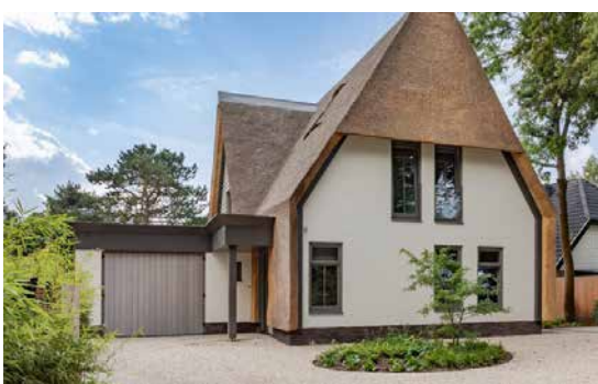
Modern ontwerp met landelijke uitstraling (Freco huis)