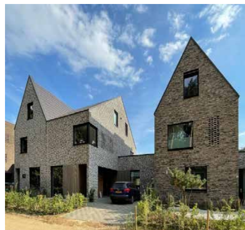
Ontwerp KOW architecten