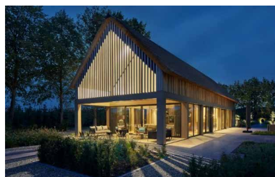
Duidelijke vormtaal (Van Os Architecten)