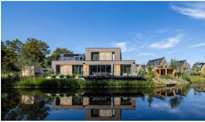
KOW architecten – Noordwijkerhout: baksteen gecombineerd met hout en massa gaat op in landschap