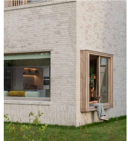
Minimalistische architectuur (studio space architecten)