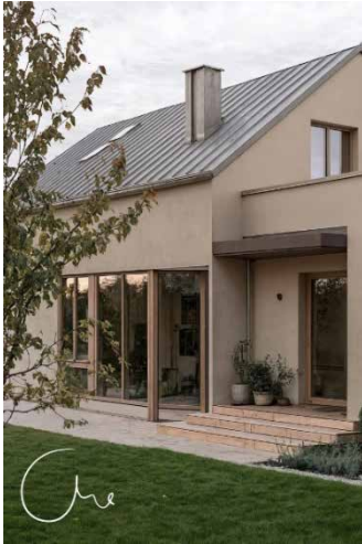
Entree in langspeel - Eich Architekten