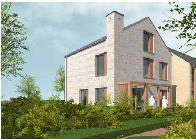
Minimalistische architectuur Hilberinkbosch Architecten