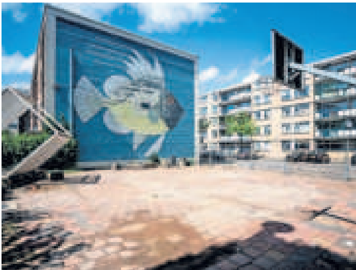
▲ In de Erasmusstraat kunnen zes gelukkigen straks hun woning zelf gaan bouwen.