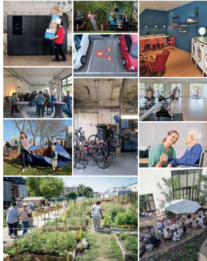
Vadapark Gedeelde plekken / voorzieningen / diensten