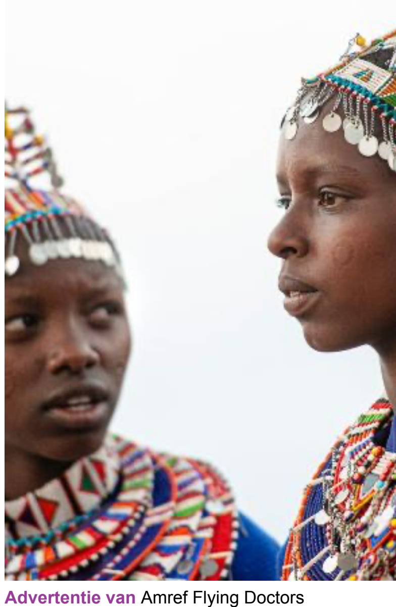
Advertentie van Amref Flying Doctors

Zeven Noord-Hollandse gemeenten schreven het kabinet een brandbrief over de nijpende woningsituatie. Ze zitten met de handen in het haar – en met hen bijna alle Nederlandse gemeenten. Hoe komen 27.000 nieuwe statushouders aan woonruimte terwijl de reguliere woningzoekenden ook al staan te dringen?